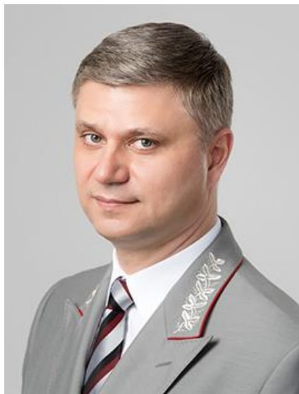
Белозеров Олег Валентинович Генеральный директор – председатель правления ОАО «РЖД»

Российская государственная вертикально интегрированная компания, владелец инфраструктуры общего пользования и крупнейший перевозчик российской сети железных дорог