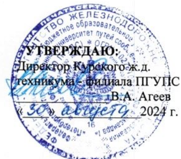
График консультаций на I семестр 2024-2025 учебного года